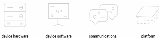
Рис.2. Базові рівні технології Інтернету речей

Варто також зазначити, що платформи можуть бути встановлені як локально, так і в хмарі.