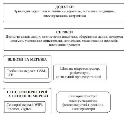
Рис.1. Архітектура IoT [3].

Четвертий рівень архітектури IoT включає різні типи додатків для відповідних промислових секторів і сфер діяльності [3].