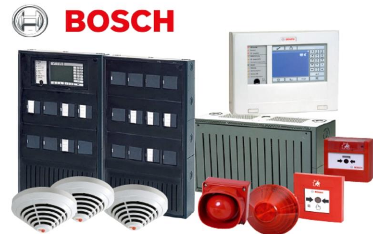
Рисунок 1 – Bosch Fire Alarm Systems

Bosch Fire Alarm System (рис.1) є однією з найпоширеніших та надійних систем для виявлення та запобігання пожежам, що використовується у великих комерційних і промислових об'єктах. Вона оснащена передовими датчиками диму, температури та вогню, які забезпечують швидке виявлення загрози та реагують на зміни в навколишньому середовищі. Система інтегрується з іншими технологіями безпеки в будівлі, такими як автоматичні системи вентиляції та освітлення, що дозволяє знизити ризик поширення пожежі. Вона також має можливість віддаленого моніторингу через інтерфейси для керування, що дозволяє здійснювати моніторинг та управління з будь-якої точки світу.