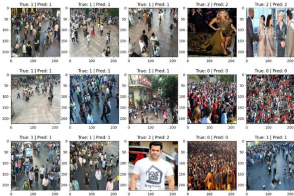
Рисунок 1 – Класифікація натовпу

кількістю людей. Для аналізу текстурних зображень можна використати, наприклад, метод LBP (Local Binary Patterns), або обробляти теплові мапи, що побудують нейроні мережі CSRNet [4], MCNN. В роботі проводилося навчання мереж CSRNet, MCNN на датасеті ShanghaiTech, який складається з двох частин: part_A – щільний натовп, part_B – помірний. Навчання проводилося окремо на part_A, окремо на part_B. Проведені дослідження показали, що підрахунок людей як в щільному натовпі, так й помірному, краще веде модель CSRNet (рис. 2).