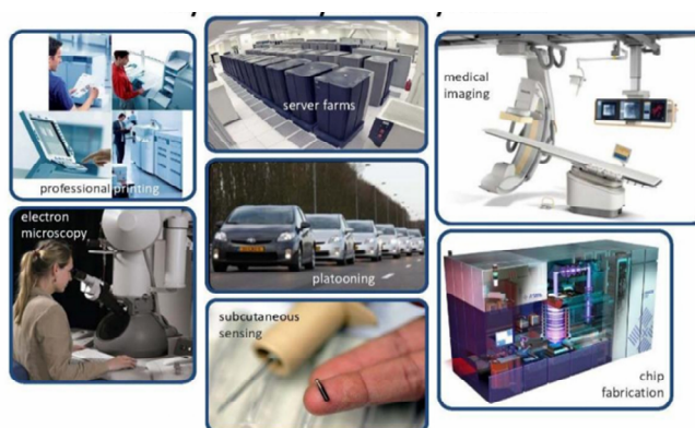
Рисунок 2 – Галузі застосування кіберфізичних систем

Найчастіше кіберфізичні системи застосовують у сферах будівництва (рис. 2), транспорту, виробництва та енергозбереження. Процеси автоматизації не обійшли й медичну та хімічну промисловість [6]. Однією з сфер застосування є і розробка мобільних КФС. Прикладами цьому може бути: засоби аналізу стану людини під час фізичних навантажень, відстеження заказу, який буде відправлений з іншої країни, автоматичного контролю вмісту вуглекислого газу та інші [6].