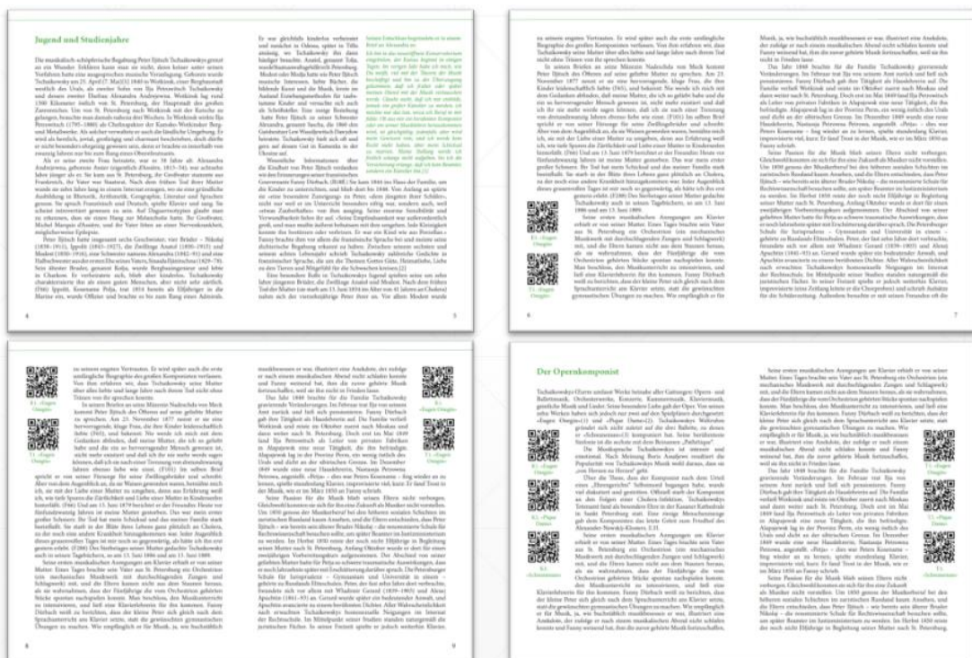
Рисунок 1 – Розміщення QR- кодів на розворотах друкованої книги