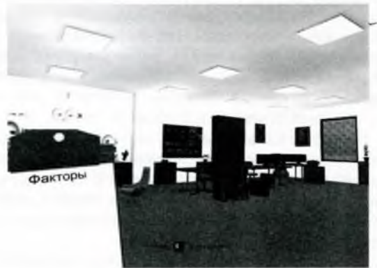
Рис.1 - Робоче місце, на якому проводиться атестація

Занурення гравця у ігровий процес за для вирішення проблеми, здійснюється завдяки моделюванню подій від першої особи. Елементами інтерфейсу, що дозволяють йому досягнути поставленої мети є: вимірювальний пристрій, перелік нормованих значень чинників виробничого середовища для кожного робочого місця та записник, у якому потрібно занотувати поточний стан. Після запуску гри і вибору варіанта, студент потрапляє в офіс ІТ компанії в ролі інспектора, якому необхідно провести дослідження робочих місць на предмет відповідності або невідповідності фактичних значень чинників нормативним. (рис.1).