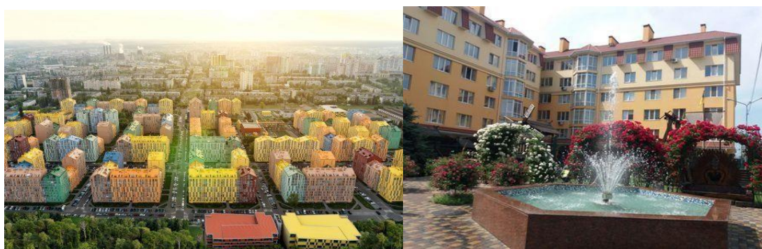
Рисунок 4. Житлові комплекси

Такі об'єкти можуть бути закритого чи відкритого типу, але у будь-якому випадку до них може бути застосований аналіз, проведений для вже згаданих критичних об'єктів.