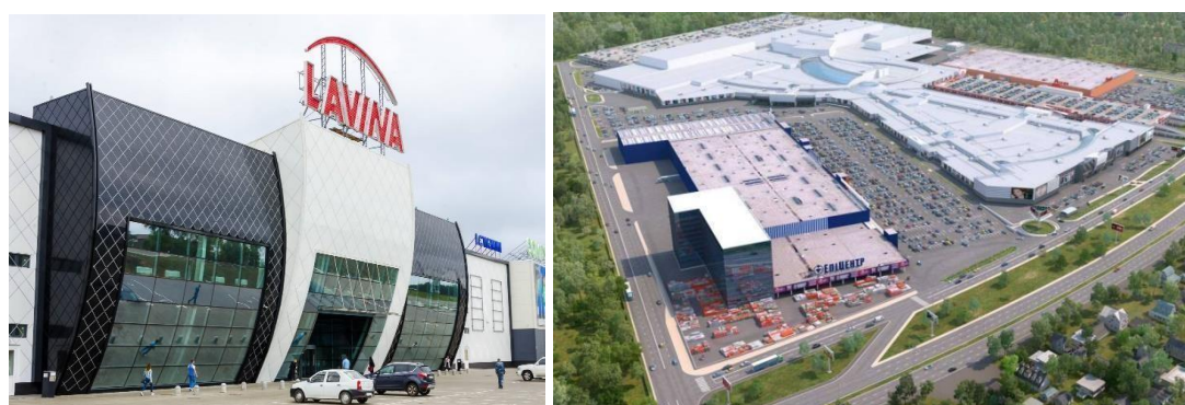
Рисунок 1 – Торгівельно-розважальний комплекс

Об'єкти критичної інфраструктури: задачі контролю доступу. В якості об'єктів, де здійснюються заходи моніторингу маємо об'єкти критичної інфраструктури. Це підприємства, будівлі, заклади тощо – реалізації на яких КС можуть мати значні соціальні наслідки. Такими об'єктами в роботі є: торгівельно-розважальні центри (рис.1); спортивні / концертні майданчики (рис.2); заклади вищої освіти (рис. 3); житлові комплекси (рис. 4) тощо.