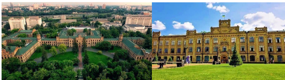
Рисунок 3. Заклади вищої освіти

Специфікою таких об'єктів є відносно контрольований перелік відвідувачів, але з енергійною імпульсивною поведінкою. Ці об'єкти, як правило, не мають замкнутого та зачиненого периметру. Являють собою структуру кампуса із багатьма будівлями та відкритими майданчиками. Здебільшого такі об'єкти обладнані системами контролю доступу та візуального спостереження. Це також місця значного скупчення людей, які відносно тривалий час перебувають на території.