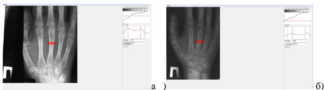
Рисунок 3 – Робочі вікна програми з результатами розрахунків при аналізі рентгенограми кисті у нормі (а) та порушенні мінералізації кісток (б)

У першому випадку отримали результат, що дорівнює 1,42 \text{ г/см}^3 , що можна вважати нормальним. Результатом розрахунку у випадку зниженої мінералізації стало значення 0,077 \text{ г/см}^3 .