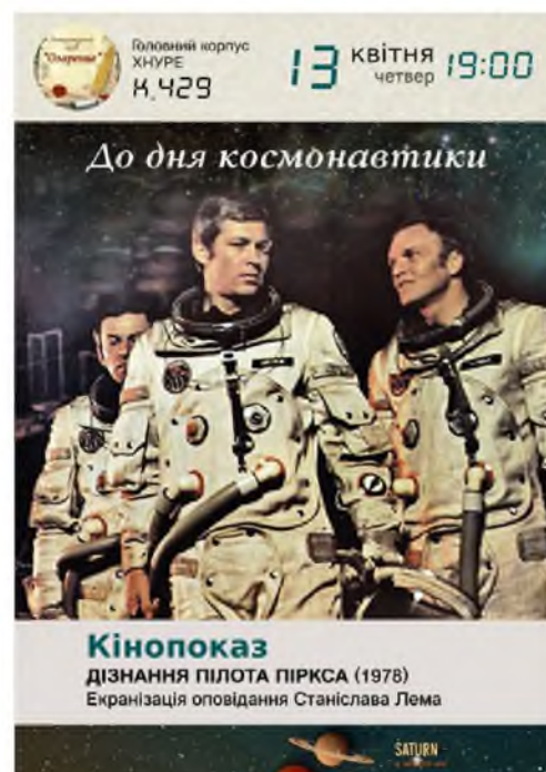
Рисунки 2, 3 – Примеры постов «вовлекающего контента»

Данный контент удовлетворяет потребности пользователя в общении, развлечении, получении бонусов и подарков и повышает лояльность и интерес к библиотеке. Идеи вовлекающего контента: