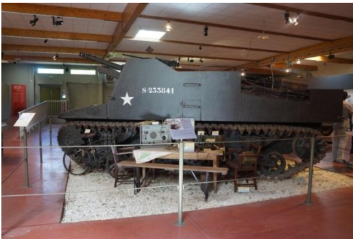
Т 40 (М9)

К концу 1941 года был разработан проект новой противотанковой САУ, вооруженной 76,2-миллиметровой зенитной пушкой М1918, показавшей себя как мощное средство борьбы с вражескими танками. Недостатки САУ Т24 впоследствии были учтены при проектировании М9. Высота бронерубки была уменьшена. Бронирования истребителя танков могло выдерживать попадания японских и немецких танков. Впоследствии в конструкцию был внесён ряд доработок: для упрощения стрельбы и процесса заряжания орудия были перемещены боеукладка и ручка механического наведения орудия. Главным недостатком САУ оставалась невысокая мобильность и большие размеры.