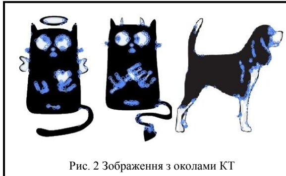
Рис. 2 Зображення з околами КТ

(рис. 2), для яких обчислені структурні описи з використанням детектора BRISK (параметри s = 176 ; n = 512 ), околи КТ на рис. 1 зображені у вигляді невеликих кілець. Перші два зображення візуально досить схожі між собою («ангел та демон»), що завжди викликає труднощі при розпізнаванні навіть людським зором.