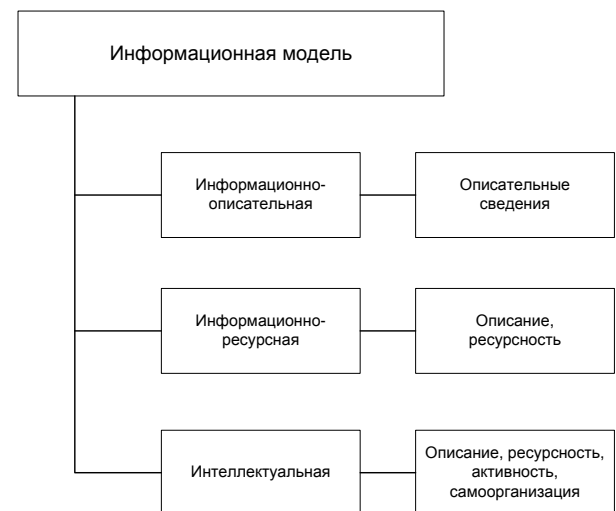
Рис.1 Классификация информационных моделей

Также в своей работе В.П. Савиных применяет три типа информационных моделей (рис. 1), а именно информационно-описательные, ресурсные, интеллектуальные [14].