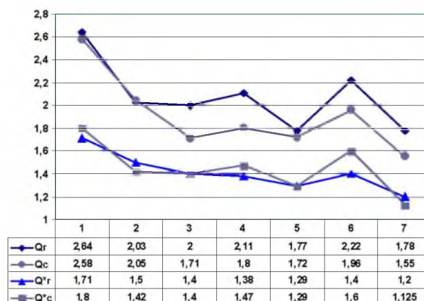
Рис. 2. Критерии структуризации и качество покрытия для примеров

На рис. 2 приведена статистика обработки различных видов матриц логических блоков с дефектными компонентами.