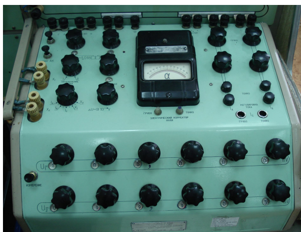
Рис. 2. Органы управления потенциометра Р345

Регулировка тока в цепи измеряемого и образцового сопротивлений в диапазоне от 10^{-6} до 10 А осуществляется с плавностью не хуже 0,001 %.