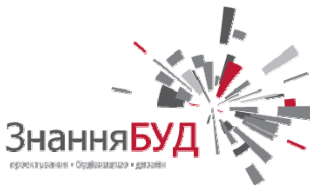
Рисунок 4 – Логотип «ЗнанияБУД»

Следующий логотип «ЗнанияБУД» представлен на рисунке 4. Логотип призван помочь потенциальному клиенту быстро сориентироваться в многообразии предложений, идентифицировать продукт с минимальной вероятностью ошибки. Данный фирменный знак не сразу понятен потребителю.