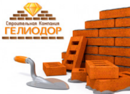
Рисунок 3 – Логотип «ГЕЛИОДОР»

Логотип строительной компании «ГЕЛИОДОР» представлен на рисунке 3. Данный логотип имеет большое количество достаточно много мелких элементов, именно это может стать проблемой при уменьшении логотипа, например, если переносить логотип на ручку. Все элементы знака будут сливаться в одно пятно, и будет непонятно что это за логотип.