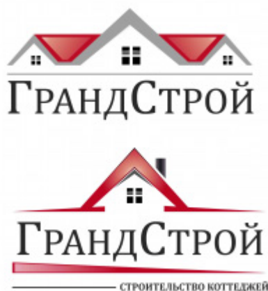
Рисунок 2 – Логотип «ГрандСтрой»

Логотип строительной фирмы «ГрандСтрой» представлен на рисунке 2. Логотип должен состоять из простых и запоминающихся форм, что не удалось использовать в данном логотипе. Градиенты. В логотипах нежелательно использовать градиент, он должен быть максимальн простым, так как каждый логотип должен кметь возможность инвертироваться, а при этом градиент не сохраняется.