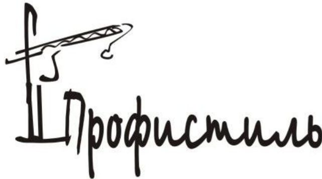
Рисунок 5 – Логотип «Профистиль»

Для того, чтобы логотип соответствовал вышеперечисленным критериям, необходимо провести большую подготовительную работу — исследовать рынок и логотипы конкурентов, подобрать несколько оригинальных визуальных образов, которые несут нужный посыл. Черновые наброски многократно пересматриваются и модифицируются.